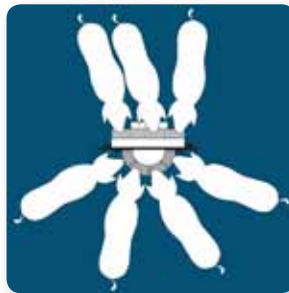
La figura muestra el tamaño proporcional de cerdos de 130 kg. en un comedero Osborne y un comedero rectangular de 4 bocas

Los comederos rectangulares fuerzan a los cerdos a estar en muy aglomerados unos con otros. El diseño redondo del comedero Big Wheel separa a los cerdos en forma radial alrededor de éste, otorgándoles más espacio y menos contacto físico. Menos contacto físico se traduce en menos competencia desperdiciada. El espacio lineal de los comederos rectangulares nunca se puede utilizar en su totalidad, como se muestra en la figura a la izquierda. Los comederos Big Wheel también usan menos espacio en comparación con los comederos rectangulares.